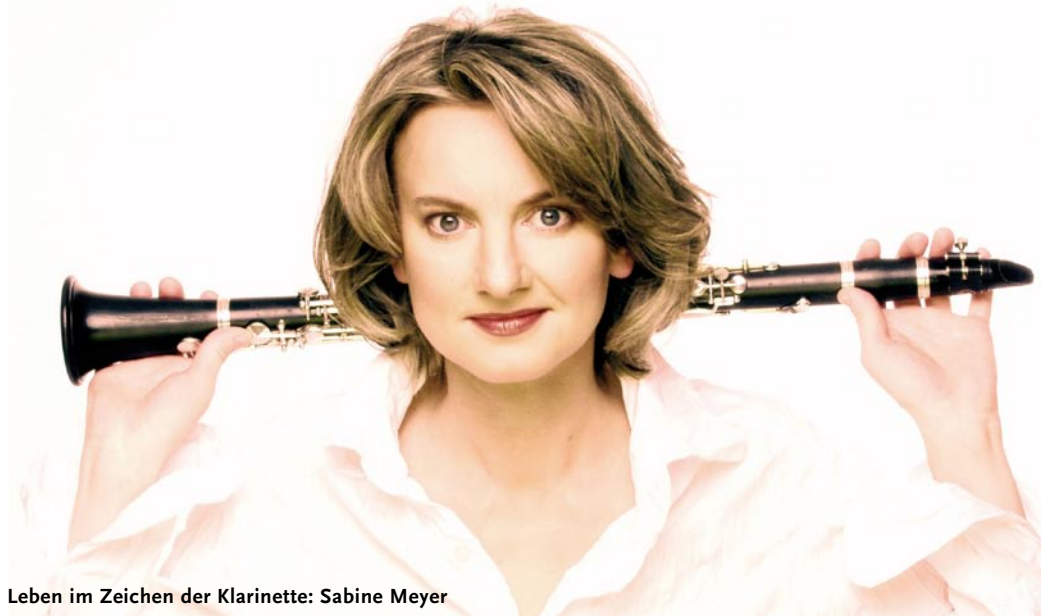
Leben im Zeichen der Klarinette: Sabine Meyer

Dass Solo-Bläser auf internationaler Ebene so erfolgreich sind wie Sabine Meyer, kommt nur höchst selten vor. Die Ausnahme-Klarinetistin, die schon mit sechzehn debütierte, hat ihrem Instrument einen beispiellosen Stellenwert im Konzertleben verschafft, indem sie sich intensiv mit der Klanggestaltung auseinandersetzte und auf diese Weise das Ausdrucksspektrum in buchstäblich unerhörte Bereiche erweiterte. „Die Klarinette befand sich lange Zeit auf dem Abstellgleis“, erzählte sie in einem Interview. „Wenn sie einigermaßen schön geklungen hat, war man ja schon ganz froh. Aber dass man versucht hätte, wie das bei Geigern oder Pianisten selbstverständlich ist, intensiv und flexibel zu spielen und verschiedene Farben herauszuholen, und das wirklich bis zum Äußersten – das hat es nicht gegeben.“ Hymnische Reaktionen, zuweilen garniert mit zweifelhaften Epitheta ornantia à la „Steffi Graf der Klarinette“ oder – kaum besser – „Primadonna assoluta der Klarinette“ sowie ein auf zwei Jahre prall gefüllter Terminkalender sind die Bestätigung für ihren ernsthaften Weg.