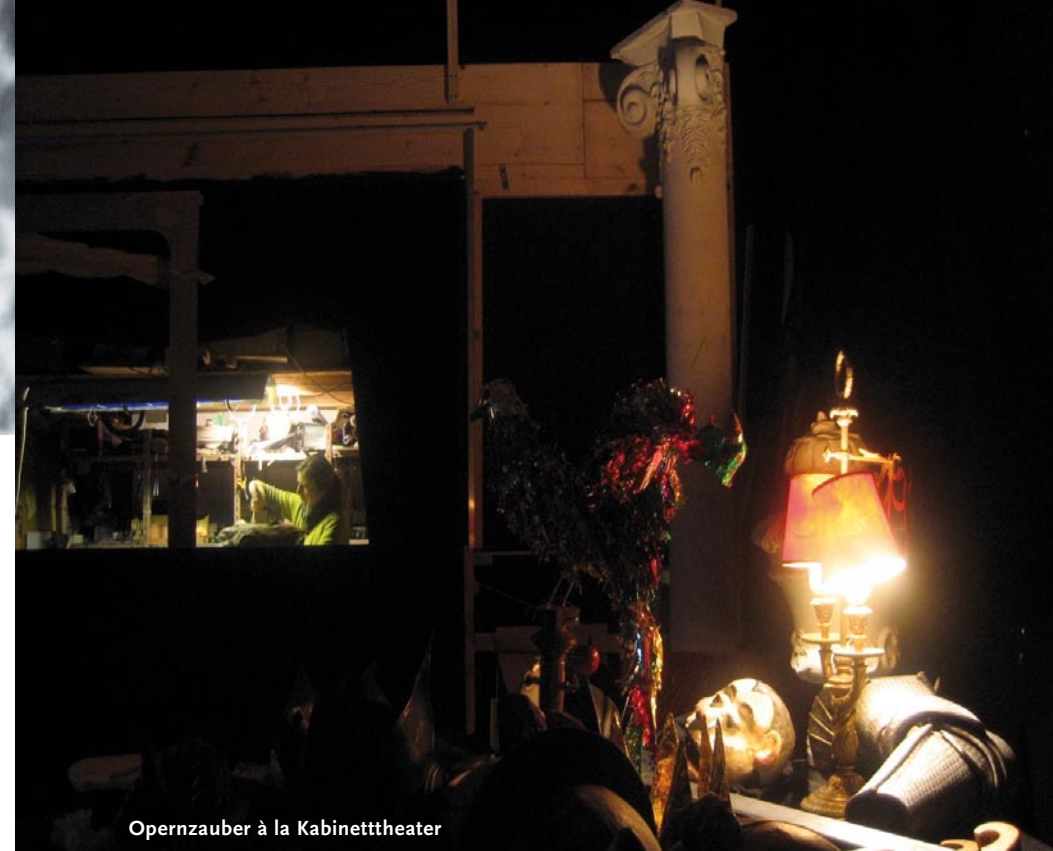
Opernzauber à la Kabinettheater