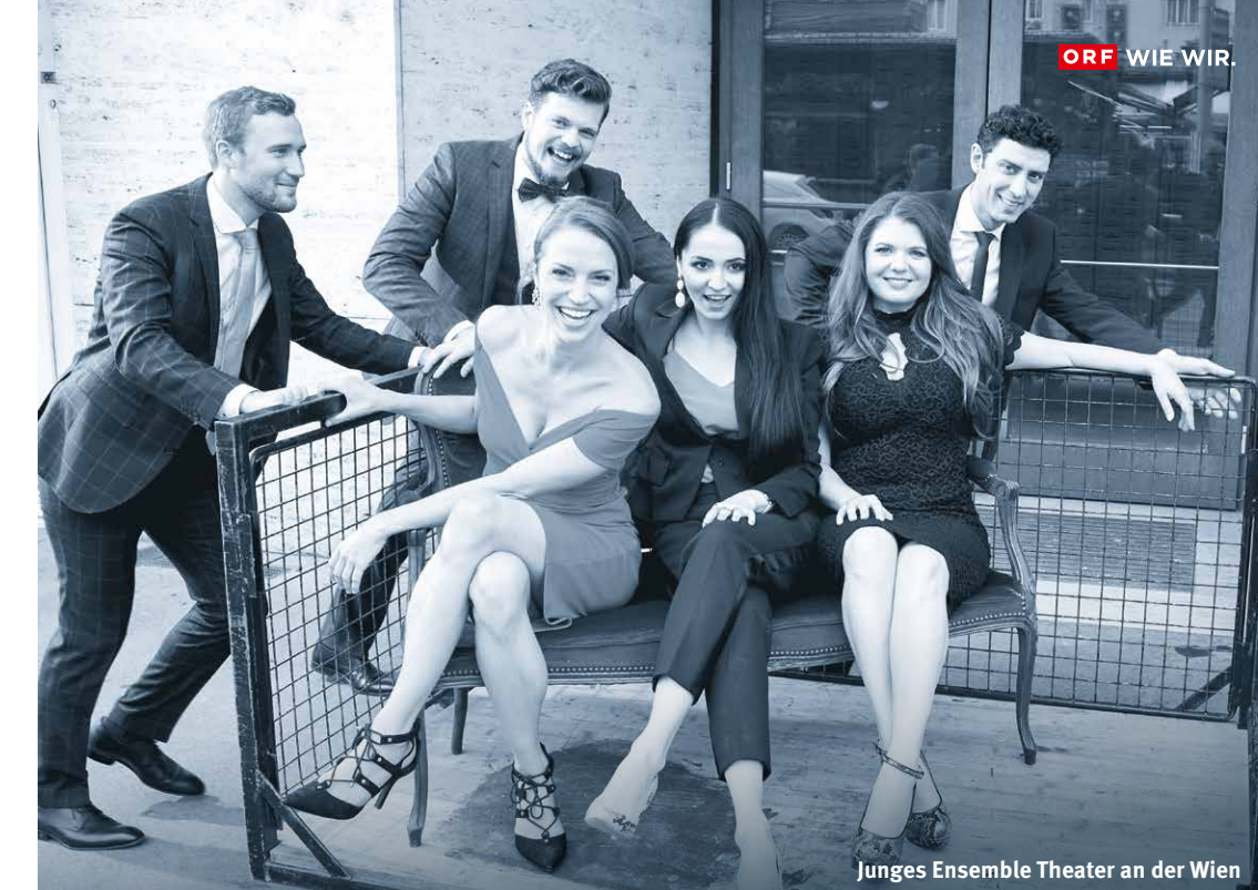
Junges Ensemble Theater an der Wien

Mit der Ö1 Club-Mitgliedschaft können Sie Kultur für ein ganzes Jahr verschenken! Ö1 Club-Jahresbeitrag: € 34,-, für Studierende € 20,-